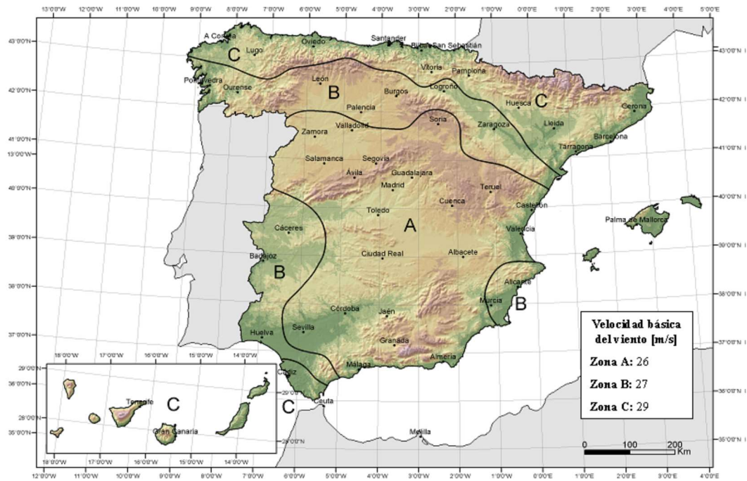
Figura 13. Mapa de zonas de diferentes velocidades de viento. [CTE]

En las Baleares corresponde una zona C, con una velocidad básica: